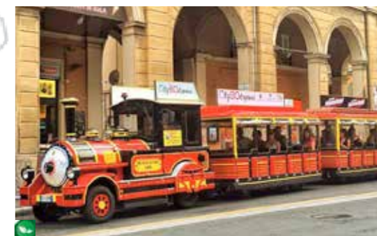
TOUR ECO FRIENDLY 100% ELETTRICO